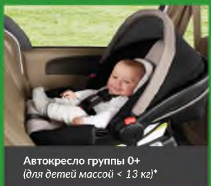
Автокресло группы 0+ (для детей массой < 13 кг)*