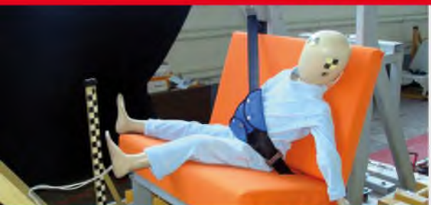
Результаты тестов использования небезопасных удерживающих устройств*

Дополнение определения «направляющая ляжка» в Правилах ЕЭК ООН № 44-04 было одобрено Всемирным Форумом (WP.29). Внесенная поправка к формулировке указывает на то, что « направляющая ляжка рассматривается как составной элемент детской удерживающей системы и НЕ может отдельно официально утверждаться в качестве детской удерживающей системы в соответствии с настоящими Правилами». Это исключает даже формальную возможность сертификации устройств типа «направляющая ляжка»!