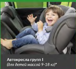
Автокресла групп I (для детей массой 9-18 кг)*