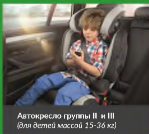
Автокресло группы II и III (для детей массой 15-36 кг)