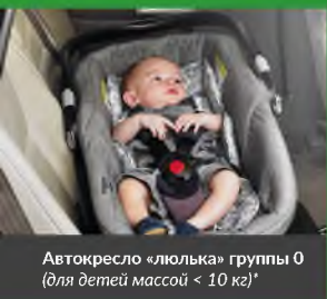
Автокресло «люлька» группы 0 (для детей массой < 10 кг)*

При покупке детского удерживающего устройства обязательно следует уточнить у продавца наличие сертификата на товар!